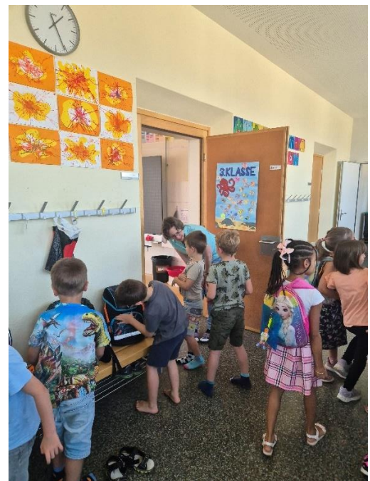
Bsüechli-Nachmittag 2024 in der 1. Klasse

Montagsvormittag, 08.50 Uhr mit den Eltern im Schulzimmer. Am Mittag werden die Schulbuskinder nach Hause gebracht.